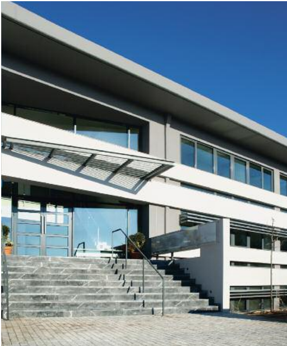
Η κεντρική είσοδος του κτιρίου.

γικού εξοπλισμού έγιναν με γνώμονα τη βέλτιστη ποιότητα εσωτερικού αέρα.