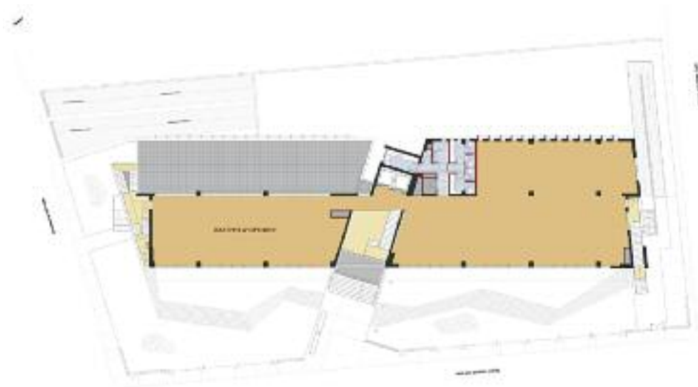
ΚΑΤΩΦΗ Α' ΟΡΟΦΟΥ