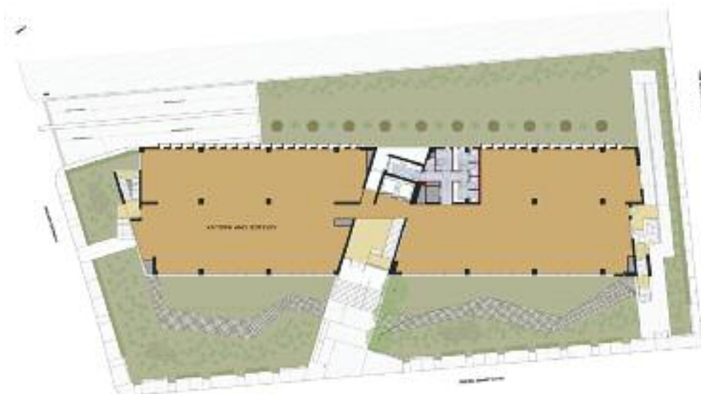
ΚΑΤΩΦΗ ΑΝΩ ΙΣΟΓΕΙΟΥ