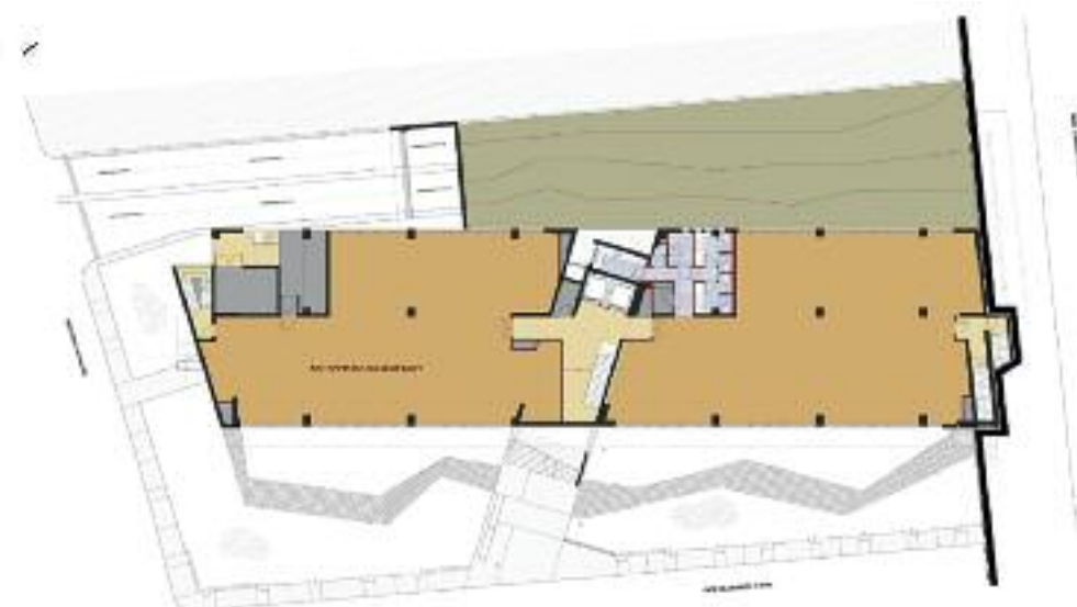
ΚΑΤΩΦΗ ΚΑΤΩ ΙΣΟΓΕΙΟΥ

Πρόκειται για ένα αμιγές κτίριο γραφείων με αποθηκευτικούς χώρους, έναν υπόγειο όροφο στάθμευσης αυτοκινήτων, φυτεμένο δώμα και οικολογικό κήπο. Στόχος του σχεδιασμού ήταν το νέο κτίριο να λειτουργήσει με γνώμονα την αειφορία. Σ' αυτήν την κατεύθυνση οι βασικές αρχές του σχεδιασμού αποβλέπουν σ' ένα ευέλικτο κτίριο νέας φιλοσοφίας, βασισμένο απόλυτα στις αρχές του βιοκλιματικού σχεδιασμού και της βιώσιμης ανάπτυξης, που στοχεύει στην εξοικονόμηση ενέργειας, στην εξοικονόμηση νερού, στην υψηλή ποιότητα του εσωτερικού αέρα και στη βελτίωση του μικροκλίματος.